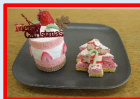
運営者 西山 ひろみ