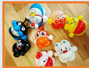
運営者 市川 勝文