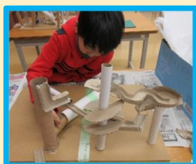
運営者 白尾 豪紀