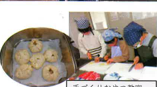
手づくりおやつ教室