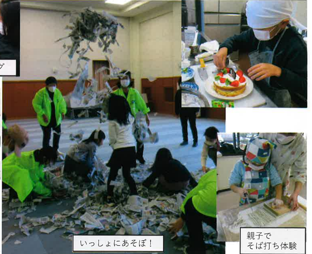
いっしょにあそぼ！