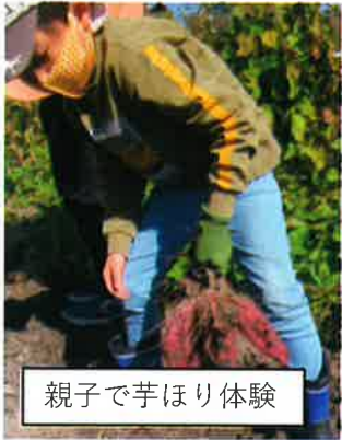
親子で芋ほり体験

この時期ならではのものや、夏オープンスクールで人気のあったものなど、20教室33回開催、延べ参加数428人でした。その中から、ピックアップ！