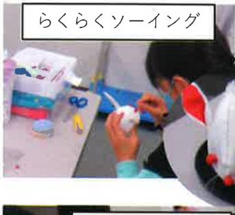
らくらくソーイング