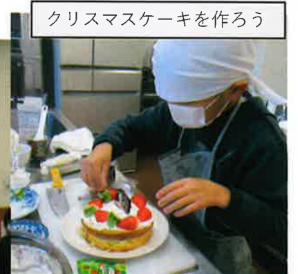
クリスマスケーキを作ろう