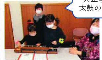
終了後の 大正琴と 太鼓の体験