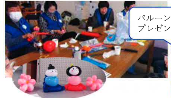
バルーンの プレゼント