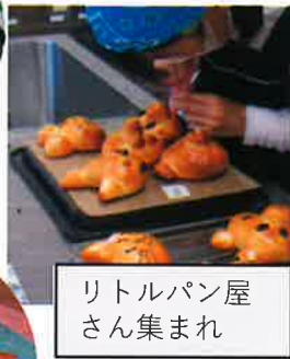
リトルパン屋さん集まれ