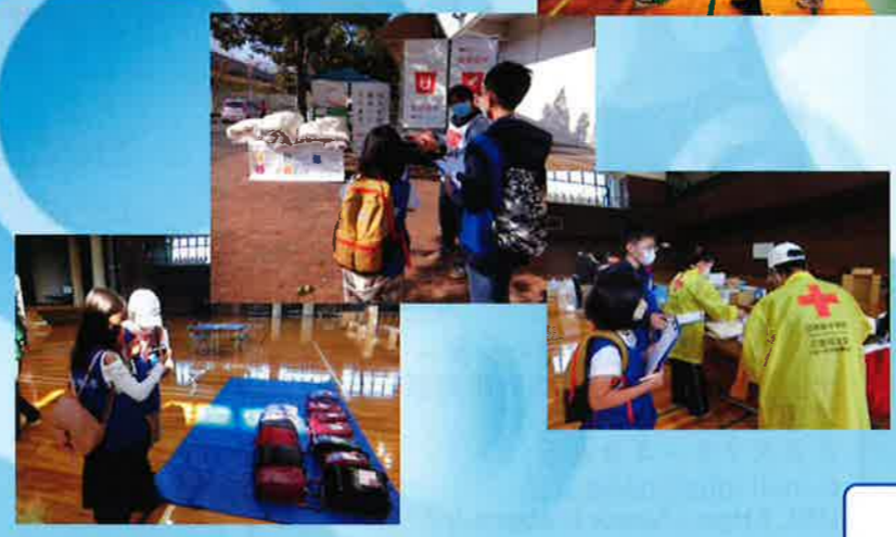
10/29トヨタ車体ブレイヴキングス