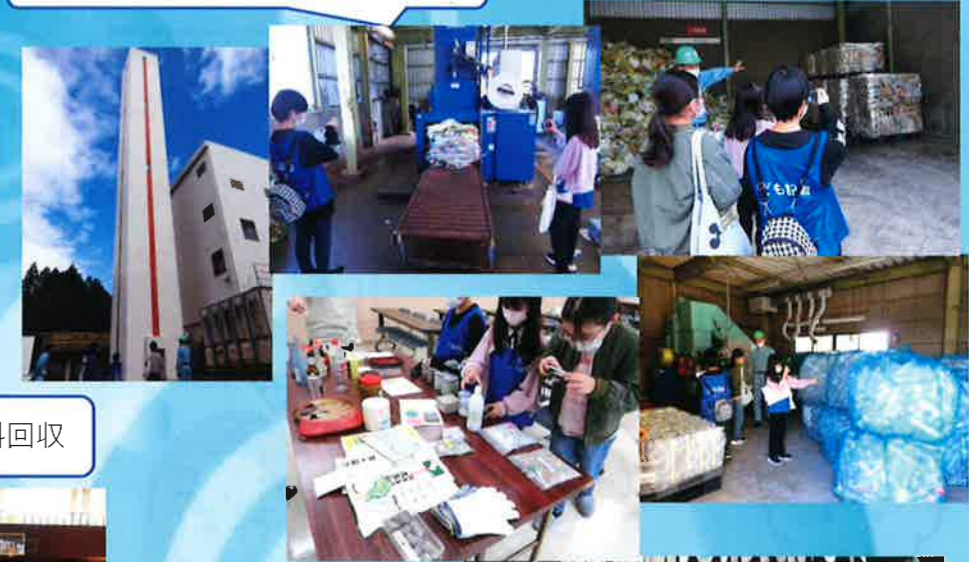
11/12デンソー衣料回収